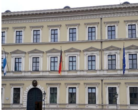
StMI in München

DEM BBB MIT BERATUNG, KOMPETENZ UND FACHWISSEN!