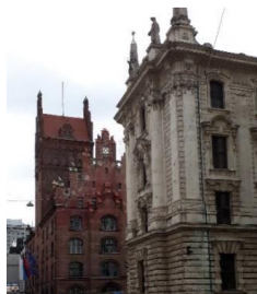
OLG München Gerichtsärztlicher Dienst