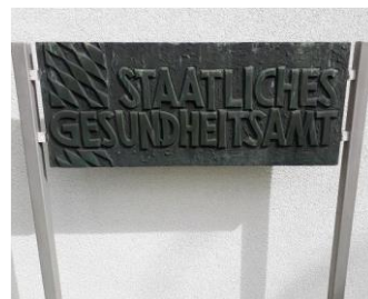
Gesundheitsämter in Bayern

© Deutsche Verwaltungsgewerkschaft Bayern e.V. (DVG-Bayern) Liebigstraße 43/I 80538 München: dvb-bayern-steymans@email.de