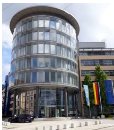
StMGP Dienstszitz München

Wir möchten im neu gewählten HPR die Kooperation der Dienststellen, das Zusammengehörigkeitsgefühl sowie den Teamgeist aller Beschäftigten im Geschäftsbereich des StMGP stärken und die Arbeitsbedingungen weiter verbessern.